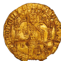
Dobra Pé-Terra D. Fernando I (1367-1383)

Escolhe as cores que achares mais atraentes e pinta esta moeda. Podes descarregar o desenho para o teu tablet ou computador e imprimir.